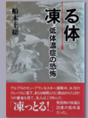
「凍る体」 (2002、山と溪谷社)

共 催 白馬村・小谷村・一般社団法人白馬村観光局・一般社団法人小谷村観光連盟・雪崩事故防止研究会 後 援 公益社団法人日本山岳会・公益社団法人東京都山岳連盟・株式会社山と溪谷社・公益社団法人日本雪氷学会雪崩分科会・一般社団法人 HAKUBAVALLEY TOURISM