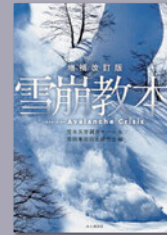
「増補改訂版雪崩教本」 (2022、山と溪谷社)