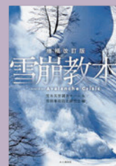
「増補改訂版雪崩教本」 (2022、山と溪谷社)