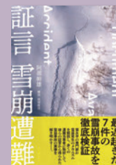
「証言 雪崩遭難」 (2023、山と溪谷社)

主催 雪崩事故防止研究会 後援 公益社団法人日本山岳会・公益社団法人東京都山岳連盟・公益社団法人日本山岳ガイド協会・株式会社山と溪谷社・大山町